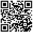
Oustaz Mouhamad GUEYE