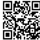
Oustaz Mouhamad DIAO